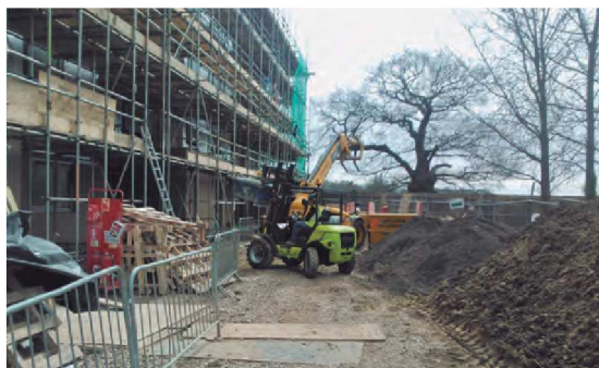
Alta maniobrabilidad en espacios angostos