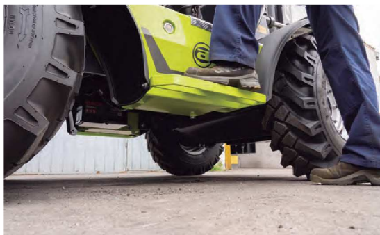
Gran altura libre al suelo