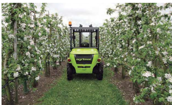
Tamaño compacto. Ideal para trabajar en cultivos estrechos

La tecnología motor intrarrueda hace prácticamente innecesario el mantenimiento. Lleva un motor mecánico de 92,5 Nm que cumple con la Fase V de emisiones. Esto permite prescindir de los filtros de partículas y sus regeneraciones. Es una carretilla compacta; ideal para conducirla dentro de edificios.